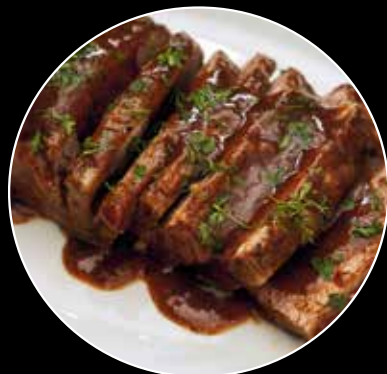
BRISKET CON NUESTRA YA TRADICIONAL RECETA Y CEBOLLA MORADA