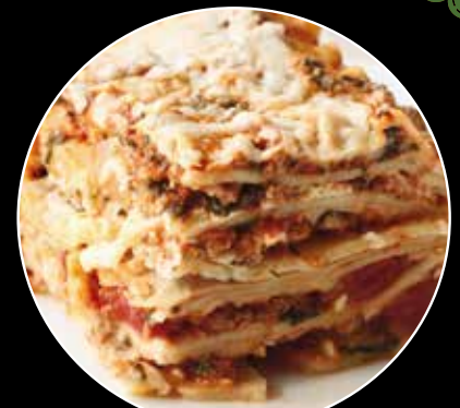
LASAÑA A LA BOLONESA