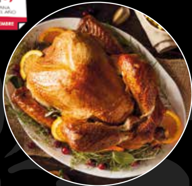
PAVO NATURAL AHUMADO CON RELLENO TURCO Y GRAVY