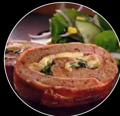
ROLLO DE CARNE RELLENO DE JAMÓN, ESPINACA Y QUESO MANCHEGO