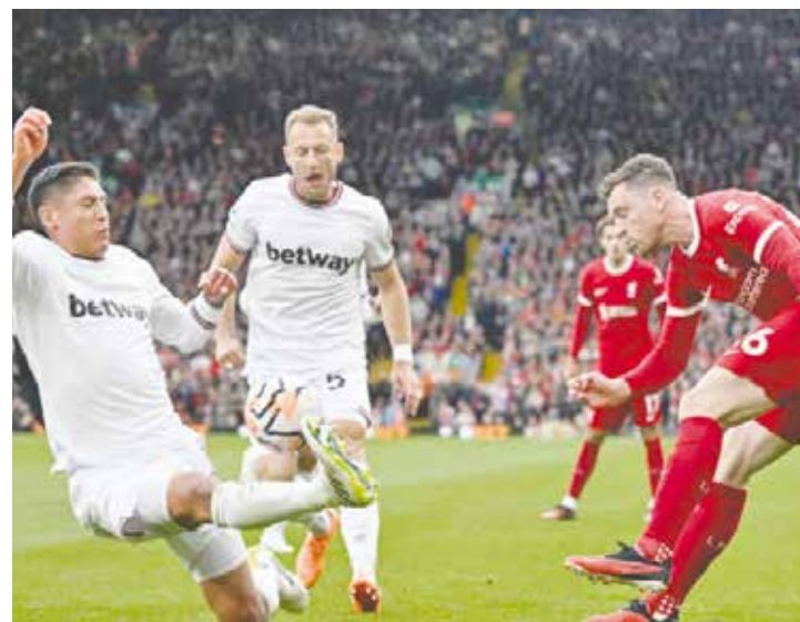
West Ham de Edson Álvarez pierde ante el Liverpool.

Arsenal se puso dos veces al frente mediante un autogol del central argentino Cristian Romero y un penal ejecutado por Bukayo Saka. Pero Son puso el 1-1 poco antes del descanso y niveló una vez más en un fulminante contragolpe apenas un minuto después que los Gunners habían anotado su segundo gol.