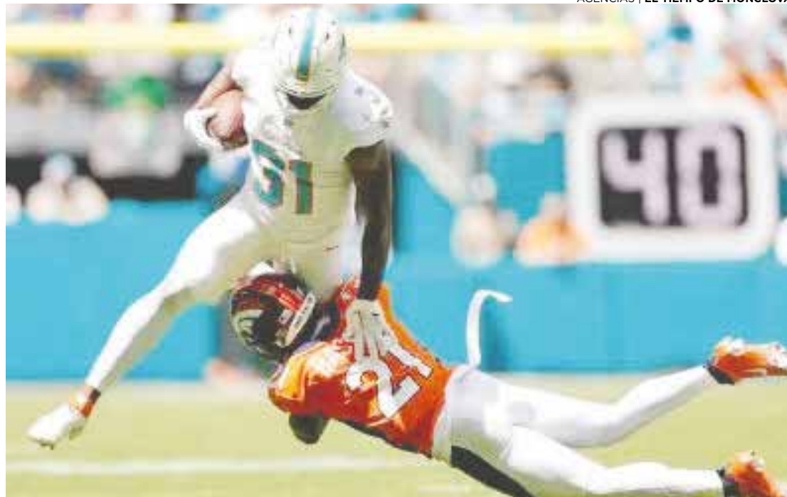
Los Delfines ganaron de una manera gigantesca a los Broncos.