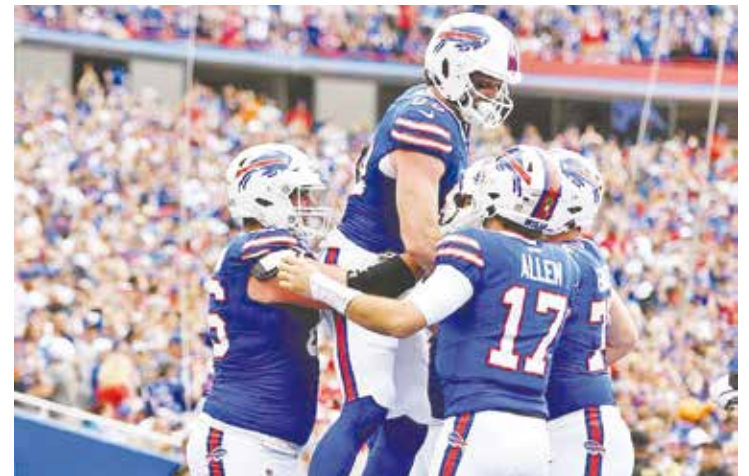
Buen triunfo de los Buffalos sobre Raiders.

Fue la tercera victoria de Kansas City sobre los Jaguars en 10 meses. Los Chiefs (1-1) ganaron su octavo seguido en la serie y evitaron convertirse en los primeros campeones del Super Bowl