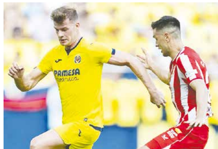
Almería y César Montes cayeron ante el Villarreal.

encuentro. Los locales alejaron de su portería a la Real Sociedad a la que le costó más llegar a los dominios de Kepa ante la intensa presión merengue. Apareció entonces Joselu, que en la primera parte había estrellado un balón en larguero, para cabecear a la fondo de la portería de la Real un centro de Fran García desde la izquierda (60'). Por detrás en el marcador, la Real Sociedad refrescó el ataque.