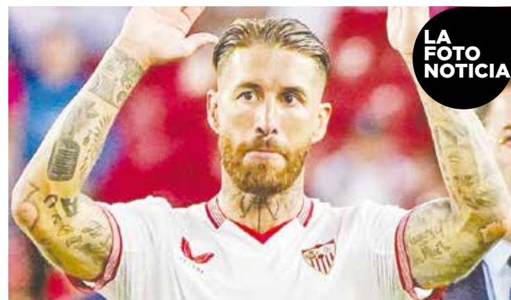
LA FOTO NOTICIA

Europa League. Este encuentro se convirtió en la primera victoria de la Roma, quien tendrá actividad de media semana cuando debute en la Europa League ante el Sheriff Tiraspol. Con goles de Renato Sanches, Romelu Lukaku y doblete de Dybala el equipo romano consumió la victoria