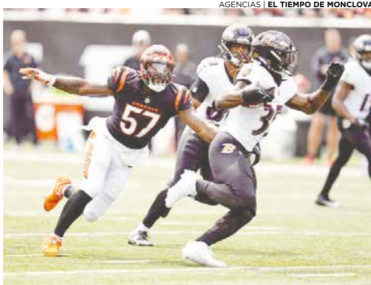
Siguen ganando los Ravens de Baltimore.

El quarterback de los Bengals Joe Burrow, quien parece mostrar indicios de sufrir los efectos de una lesión en la pantorrilla sufrida en la temporada baja, completó 27 de 41 pases para 222 yardas y dos pases de anotación. Burrow ape-