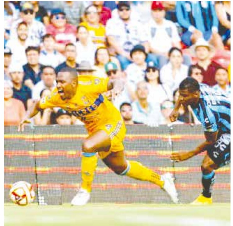
Tigres y Gallos empatan en aburrido partido.