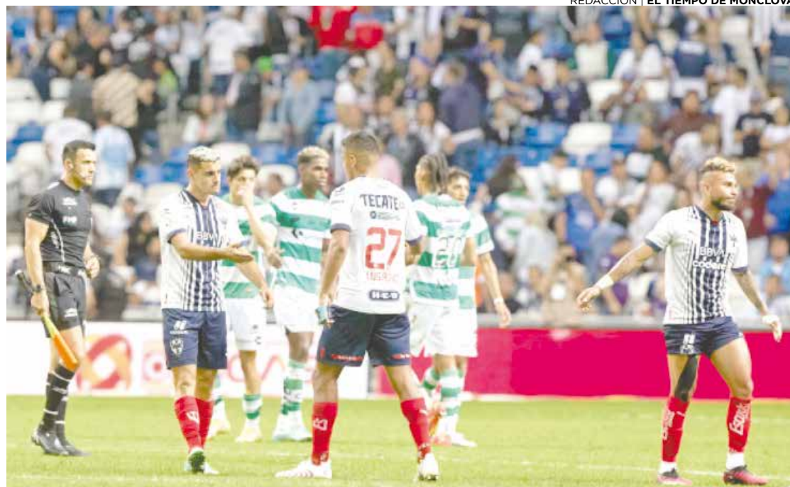
Santos remonta y gana ante el Monterrey.

Si bien Pumas llevaba la ventaja, empezó el vendaval rojo al ataque. Los pupilos de Ignacio Ambriz se fueron al frente y estuvieron muy cerca de igualar.