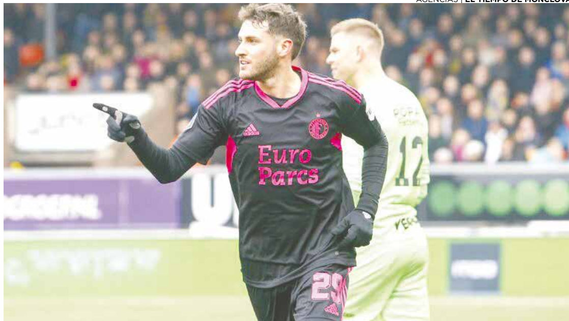
Santi Giménez anota su gol 19 en la victoria del Feyenoord.