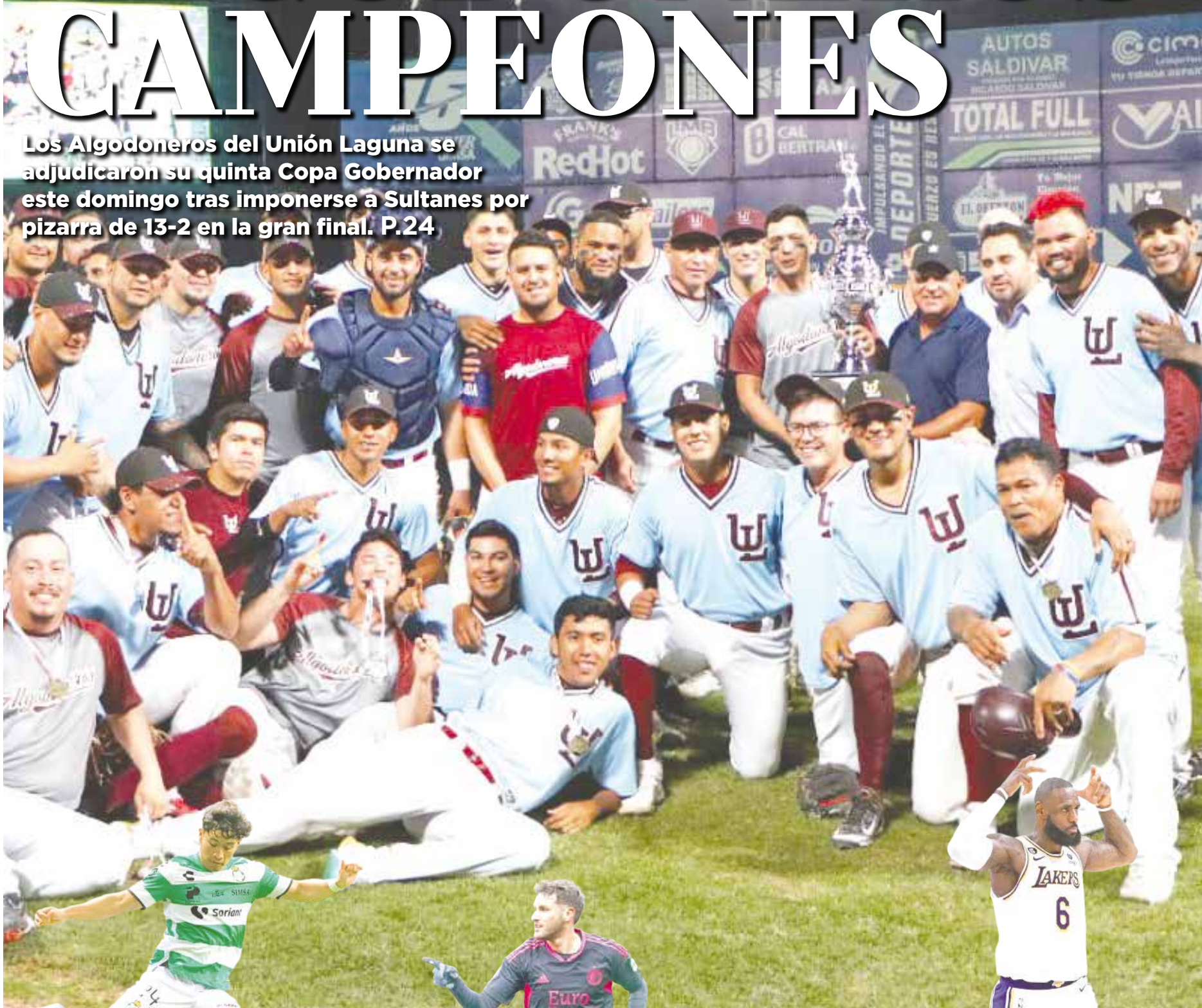
Rayados cayó por segunda vez ahora gana Santos P.3

Los Algodoneros del Unión Laguna se adjudicaron su quinta Copa Gobernador este domingo tras imponerse a Sultanes por pizarra de 13-2 en la gran final. P.24