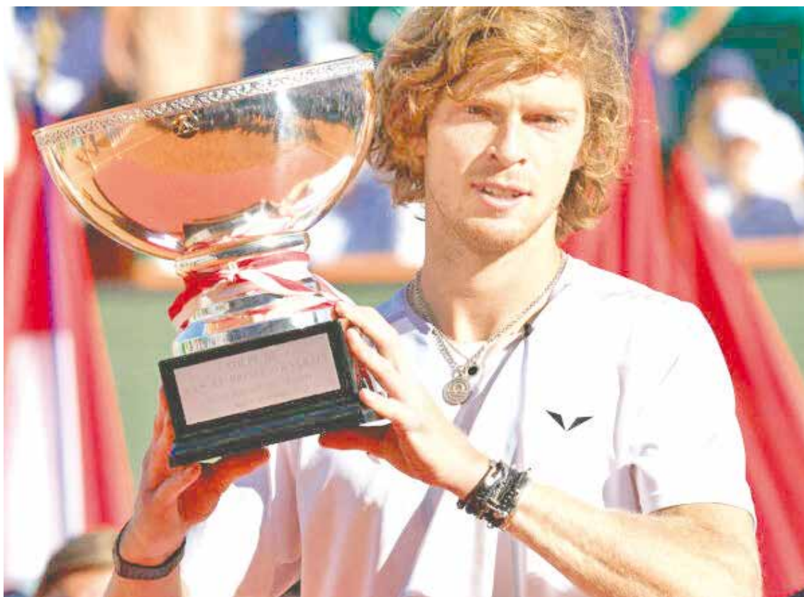
El tenista ruso Andrey Rublev ganó el domingo el Montecarlo 1000.

FINAL El ruso dio un partidazo ante Rune para conseguir su primer título.