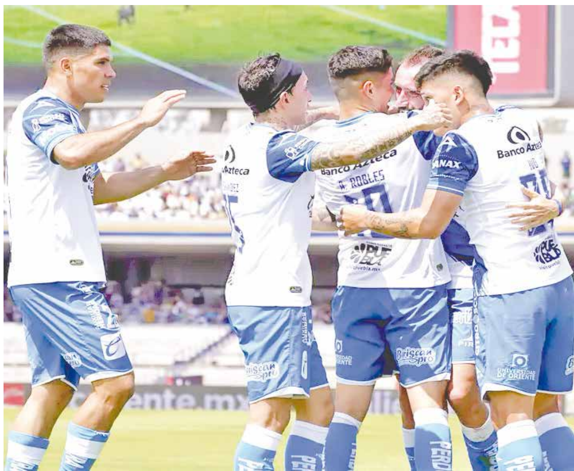
Los Pumas perdieron en su casa ante el Puebla por 4-2.

FÚTBOL La Franja, que tuvo superioridad numérica desde el minuto 20, castigó a la UNAM.