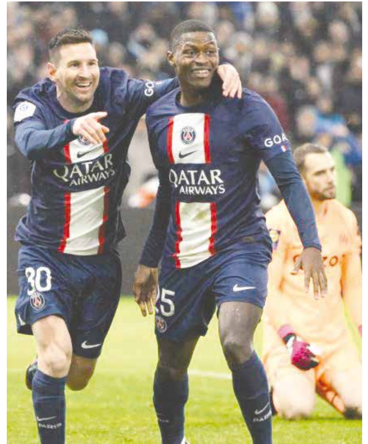
El PSG vence al Marsella tres goles a cero.