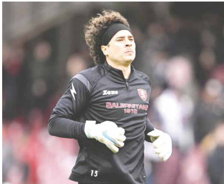
Buena actuación tuvo 'Memo' Ochoa el domingo.