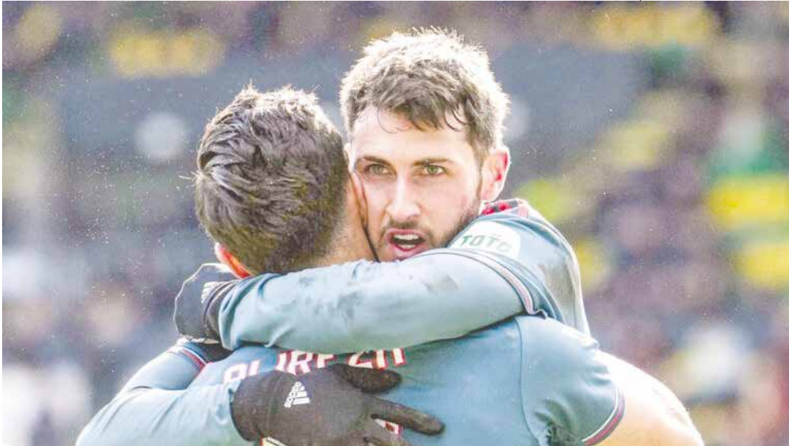
Santiago Giménez anota gol en el triunfo de su equipo el Feyenoord.