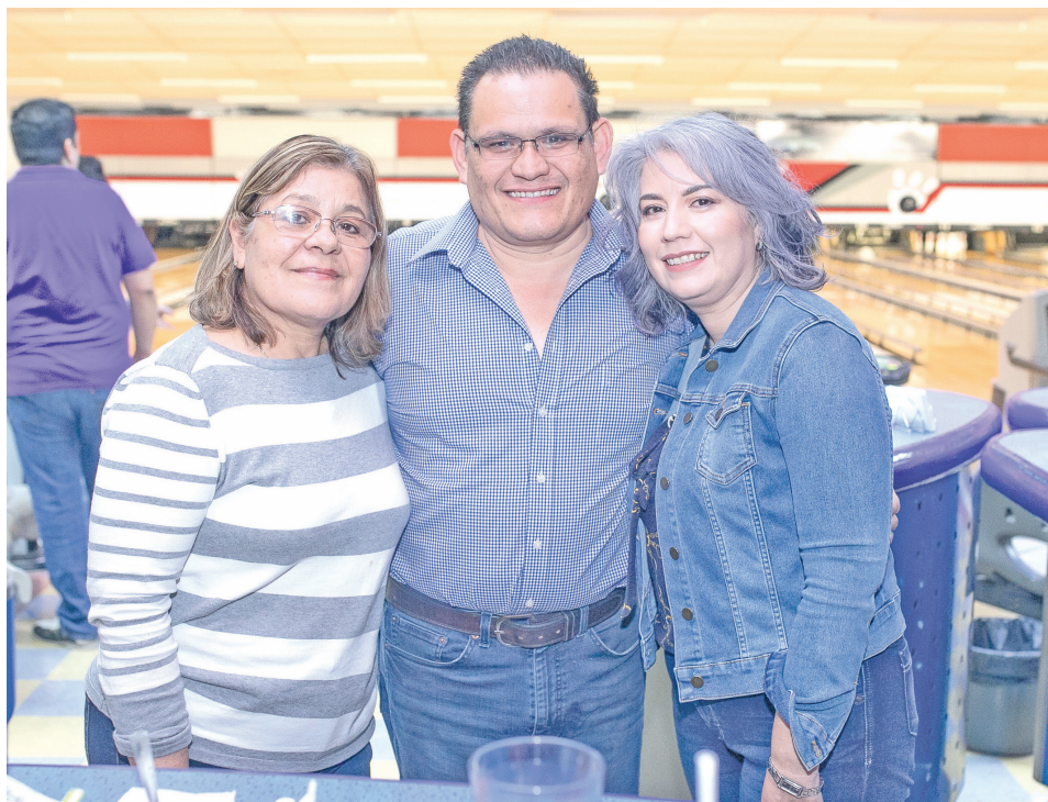
Fue un excelente fin de semana para pasarla en familia.