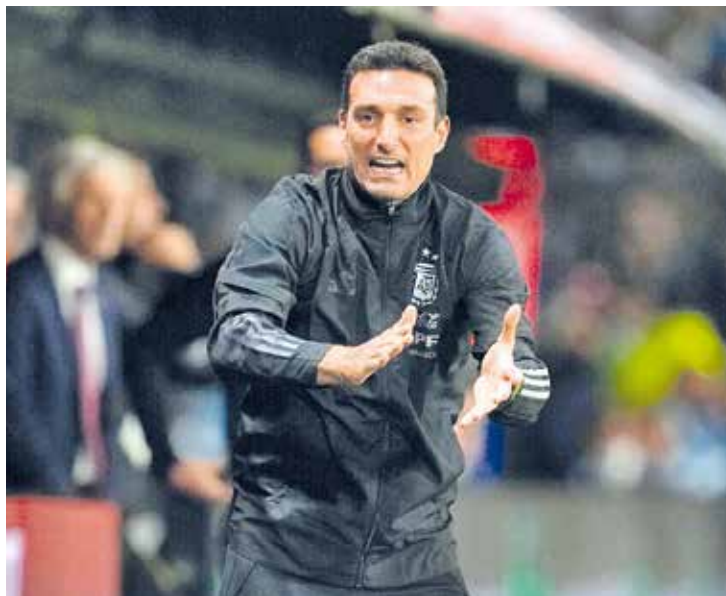
Casi lista la selección de Argentina.

1) Emiliano Martínez- Portero 2) Gerónimo Rulli- Portero 3) Franco Armani- Portero