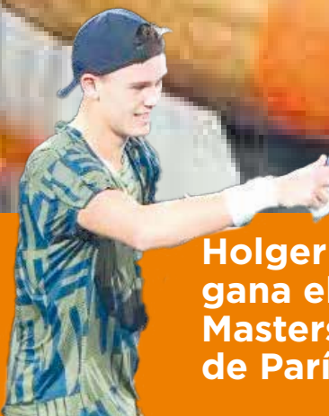
Holger Rune gana el Masters 1000 de París P.2

El dominicano Jeremy Peña, tras ser el novato de Astros, logra la designación del MVP en la Serie Mundial pag. 6