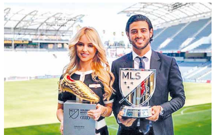
Vela nunca estuvo en los planes del "Tata".