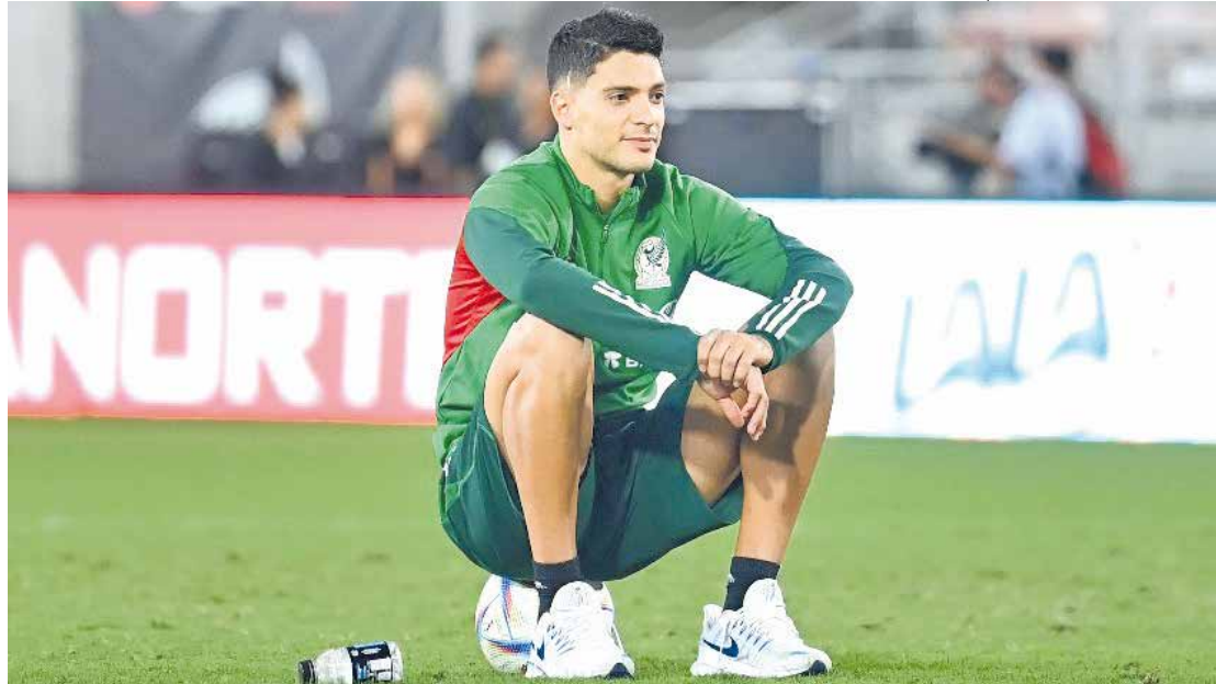
Raúl Jiménez reportó con la Selección en Girona.