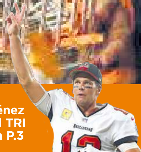
Tom Brady crea magia en victoria de Bucs P.5