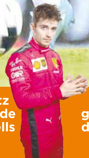
Leclerc gana el GP de Bahrain P.8