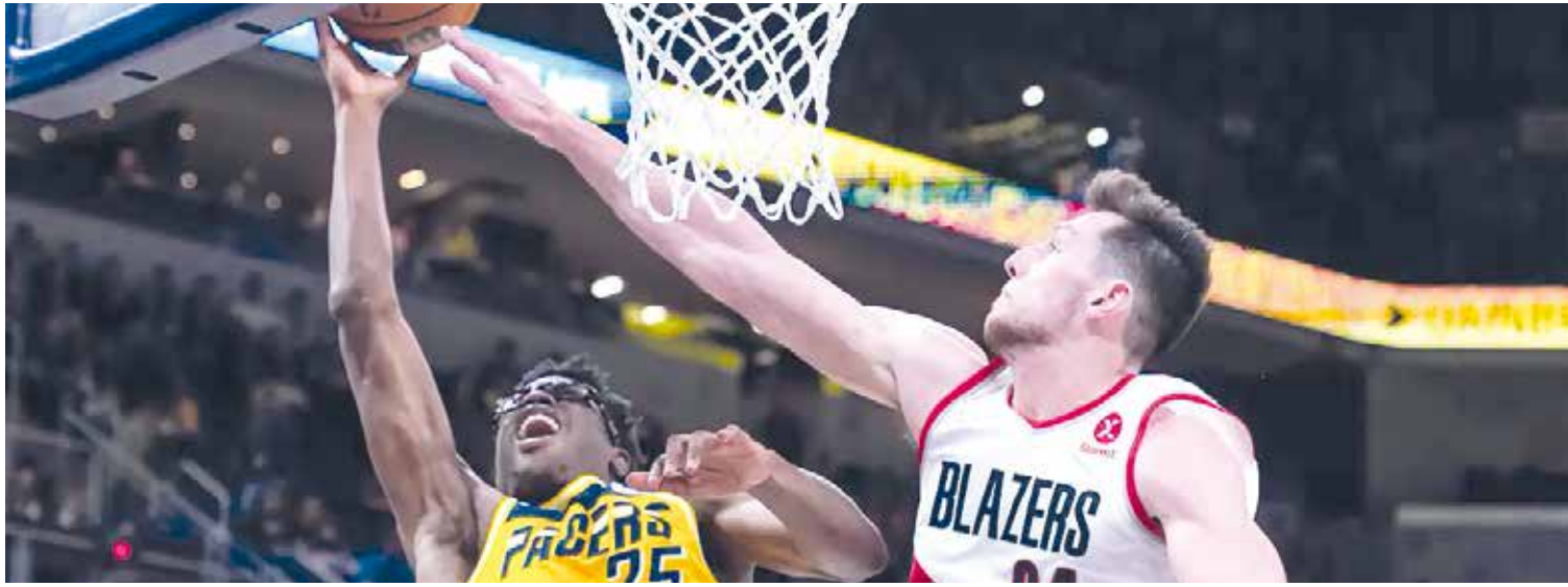
En el último cuarto se definió el triunfo de los Indiana Pacers.