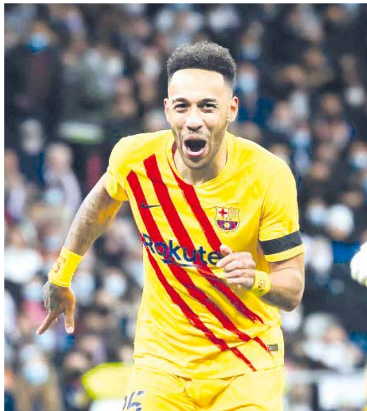
Barcelona arrolló al Real Madrid.

FÚTBOL Xavi Hernández supo motivar a sus jugadores, porque en verdad saltaron al campo inspirados.