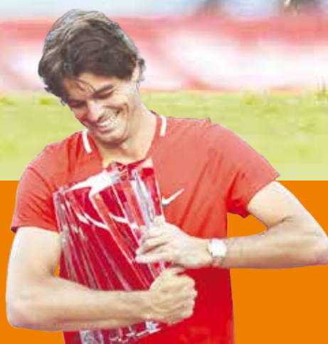
Taylor Fritz campeón de Indian Wells P.5