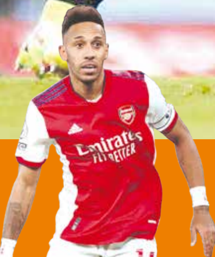
Doblete de Aubameyang Gana a Real M. P.4