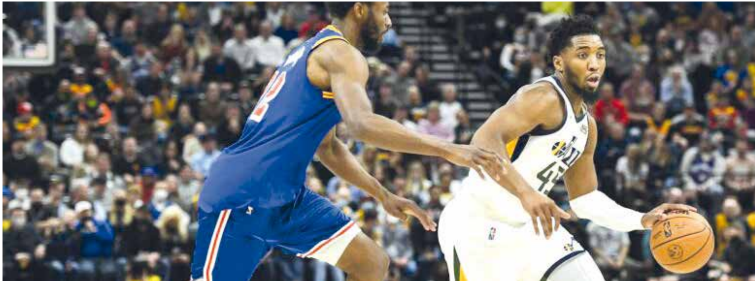
Donovan Mitchell y Rudy Gobert las bujías del triunfo de los Jazz de Utah.