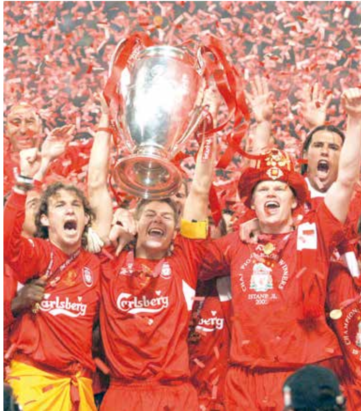
Liverpool se lleva su novena copa.

FÚTBOL El equipo de Jurgen Klopp conquista su novena Copa de la Liga de Inglaterra.