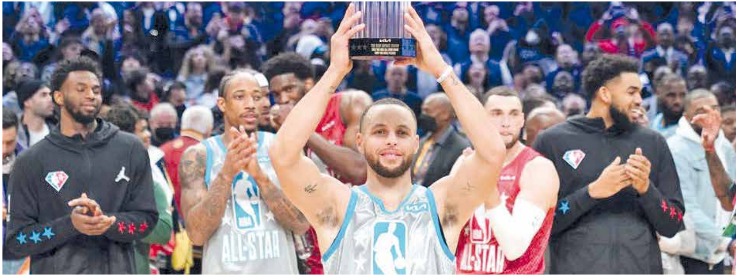
En el marco del Juego de Estrellas de NBA se rindió homenaje a sus mejores jugadores.