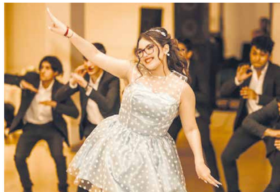
La quinceañera se lució en su baile de celebración a lado de sus chambelanes.