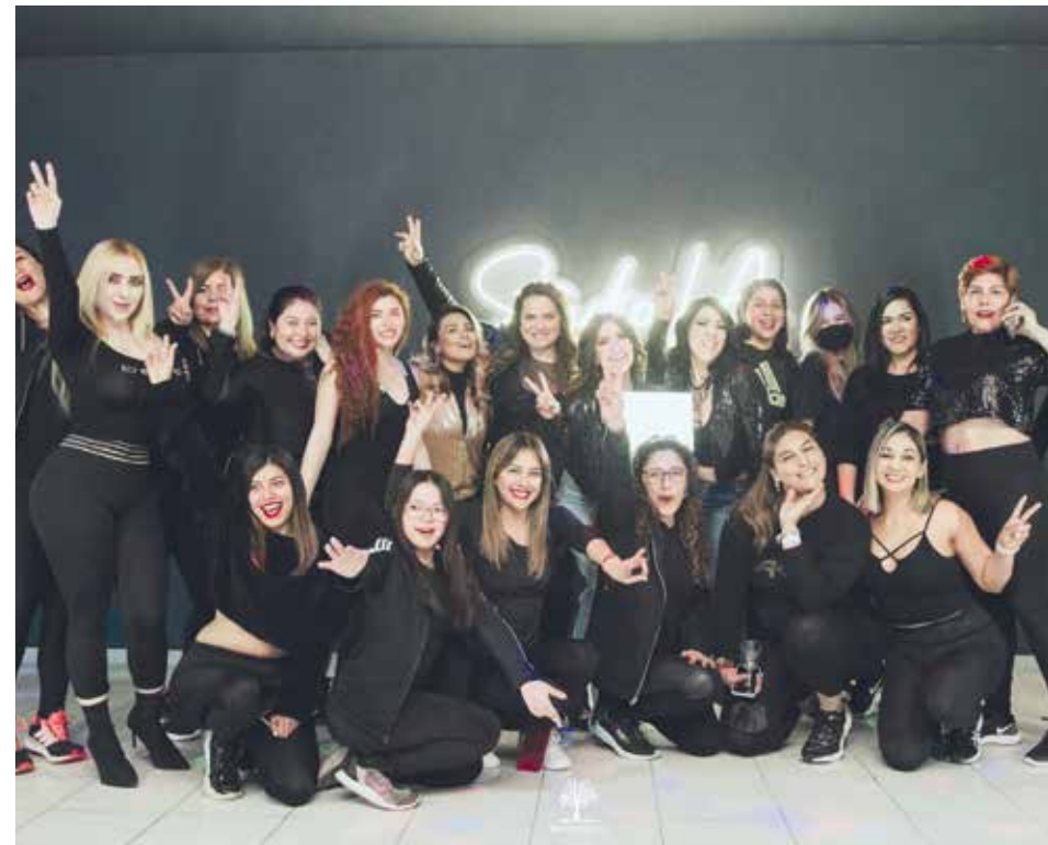
Las chicas felices de asistir a la primera clase de Studio LA durante su inauguración.