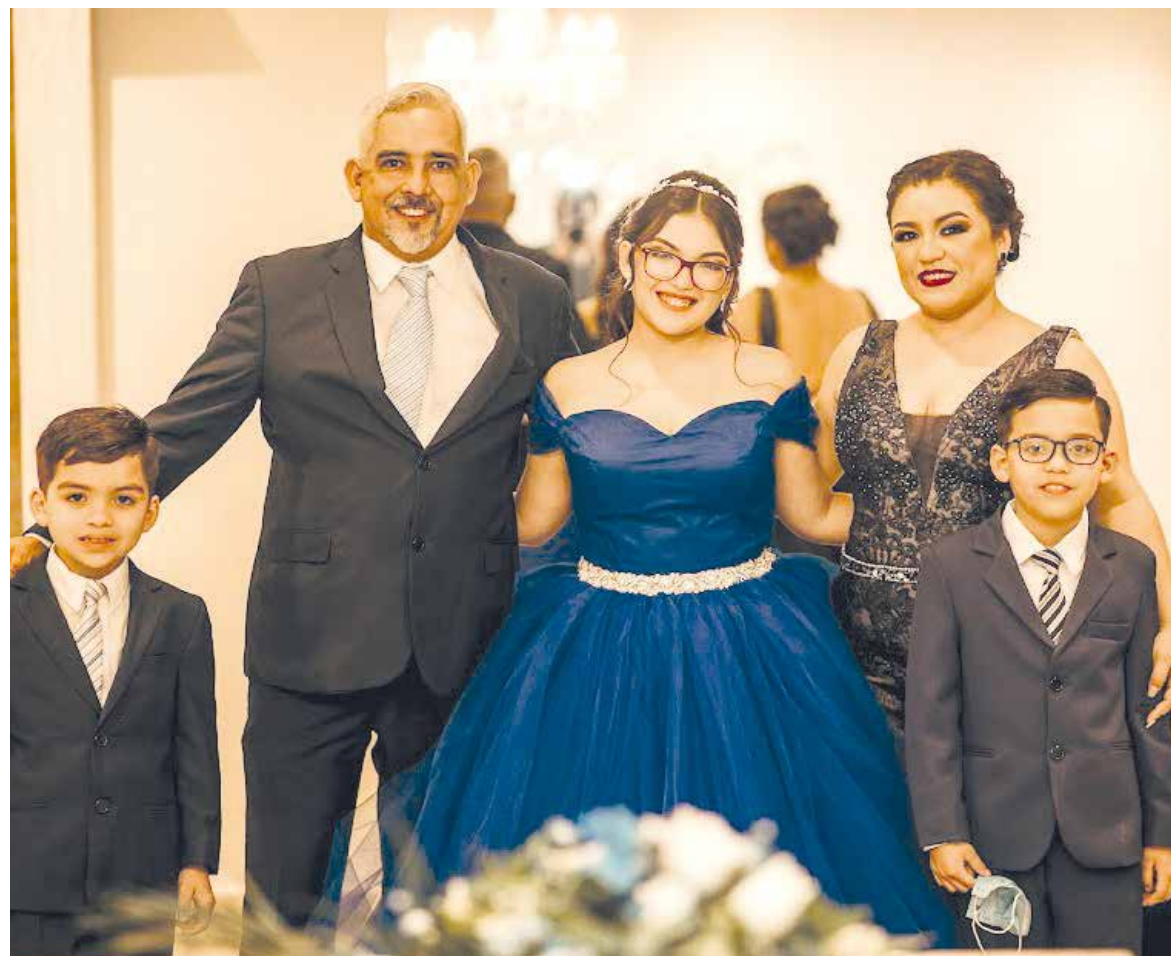
Su familia estuvo más que feliz de estar a su lado en una celebración tan importante.