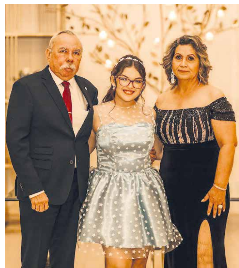
Sus invitados no dudaron en tomarse una fotografía a lado de su anfitriona.