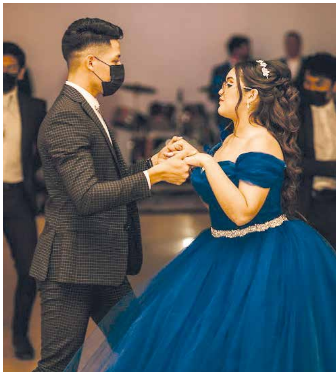
Uno de los espectaculares shows de la noche fue el baile junto a su chambelán principal, el cual encantó a todos.