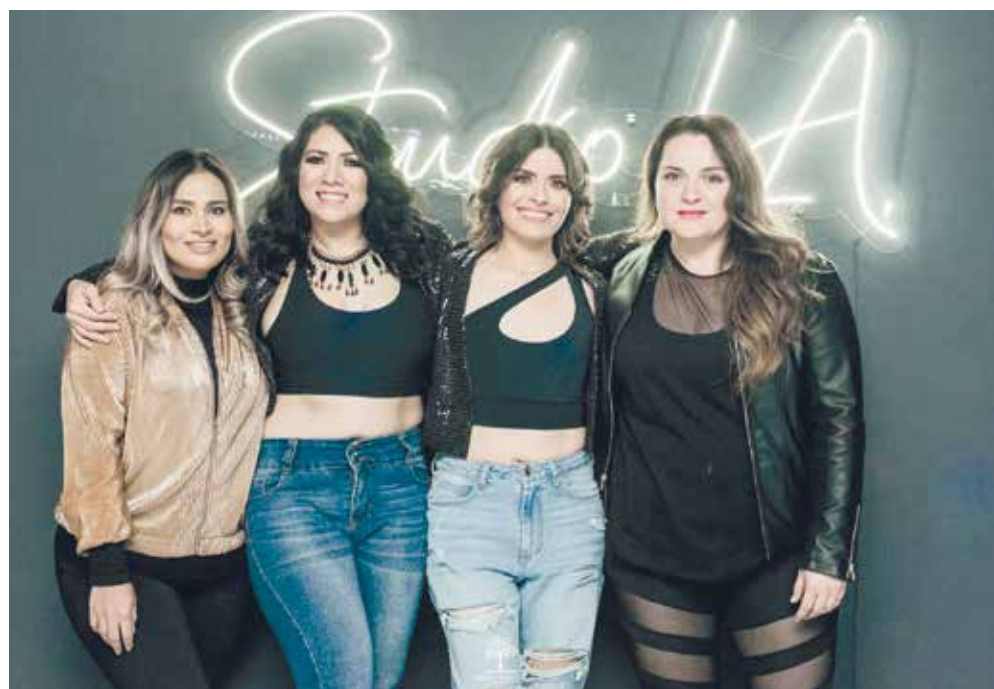
Sin duda alguna la amistad es un punto clave, es por ello que se dieron cita para apoyar a sus amigas en tan importante día.