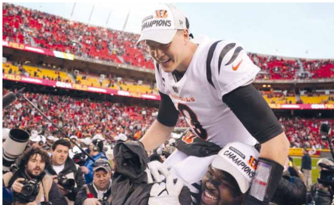
Tal como se esperaba, dramático el triunfo de Bengals sobre Chiefs.

El empate. Los Cincinnati Bengals empataron el partido con pase de la dupla maravilla de este 2022: Joe Burrow y Ja'Marr Chase. Esto dejaba el marcador 21-19 a favor de los Chiefs y la conversión empató la pizarra a 21 puntos. Después, un gol de campo de McPherson por parte de los Bengals y uno de Butker sin tiempo en el cronómetro mandaron el