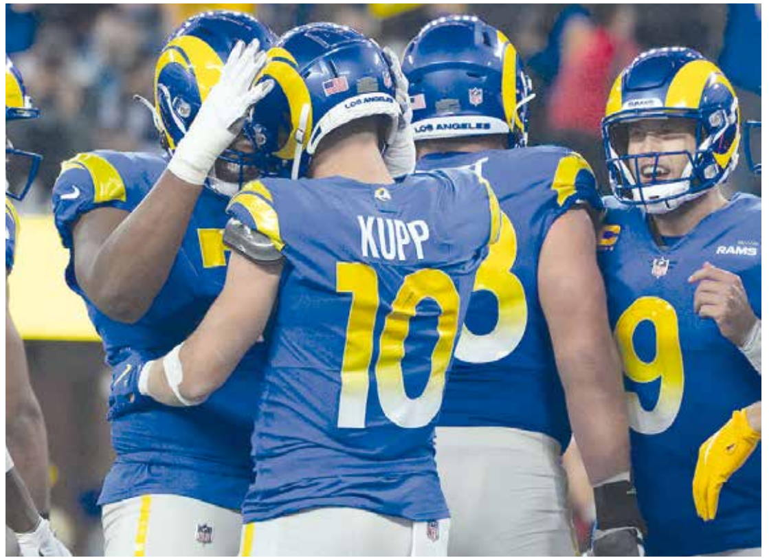
Rams termina por imponerse ante San Francisco 20-17.

Se crecieron. Lejos de apagar a la escuadra visitante, sucedió todo lo contrario. Por medio de Deebo Samuel empezaron a dominar a la unidad comandada por Aaron Donald y San Francisco anotó un total de 17 puntos sin respuesta. Los Rams ya no tenían tiempos fuera, por lo que necesitaba de su defensiva y esta apareció. En apenas tres jugadas sacaron a la unidad de Jimmy Garoppolo, y una vez más Stafford movió las cadenas hasta territorio rival. Entre Kupp y Odell Beckham Jr.