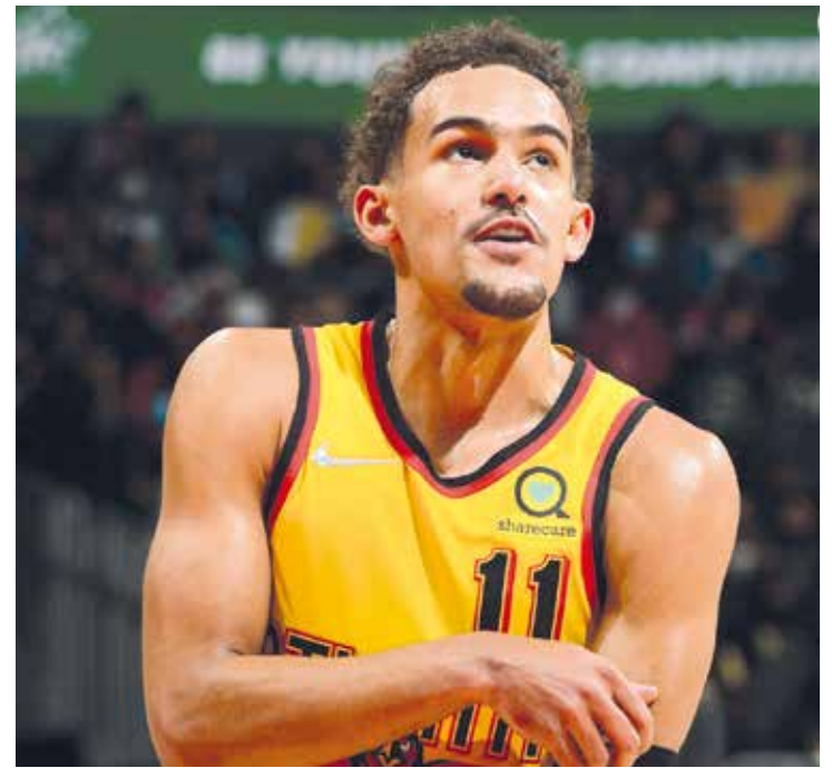
Buen triunfo de los Hawks sobre los Lakers.

Jordan se levantó del asiento de su palco, dio media vuelta y se retiró, sin embargo, dicha actitud fue reprochada por los aficionados de Charlotte Hornets, ya que se trata del dueño y referente histórico de la competición.