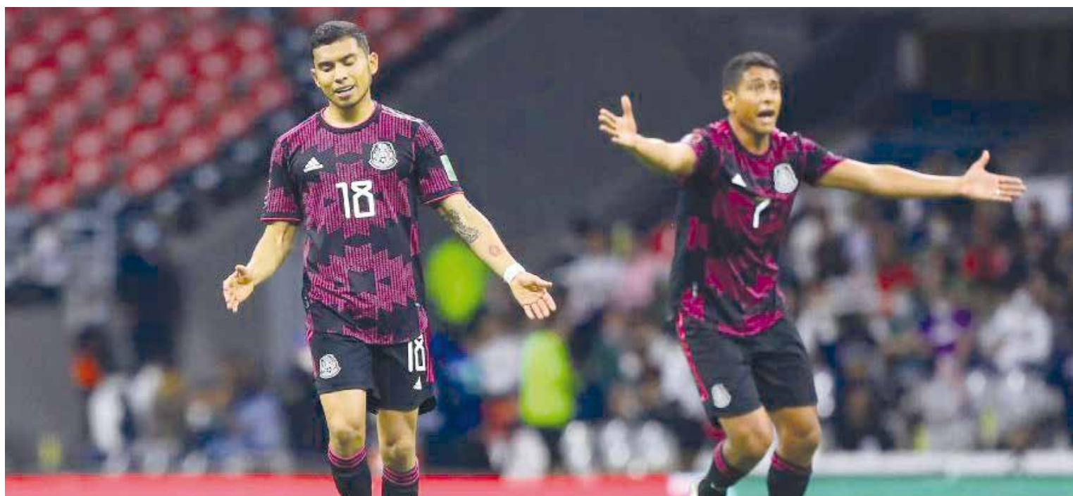
Un gris empate logra la selección mexicana ante su igual de Costa Rica.